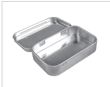
▲ 高温使用の金属コンテナ