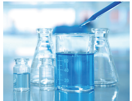
▲ 薬品が付着する対象物